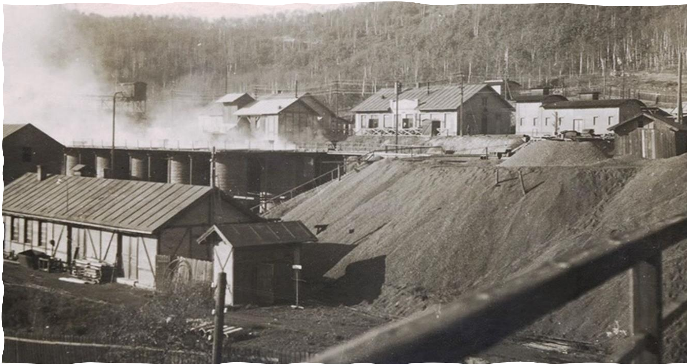
Navazujeme na tradici důlního zámečnictví od roku 1861