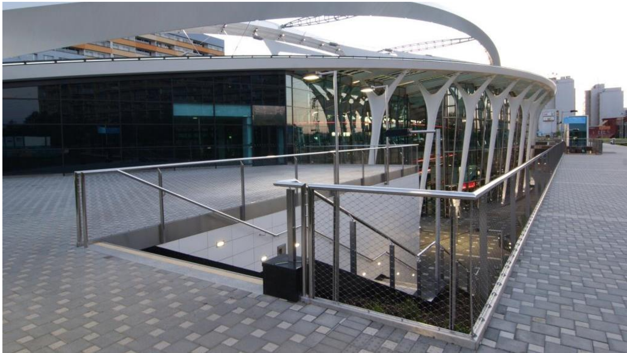
Stanice metra Strižkov